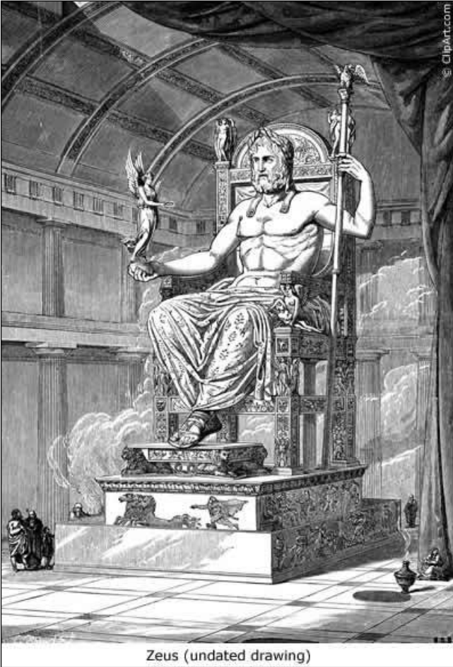
Zeus (undated drawing)